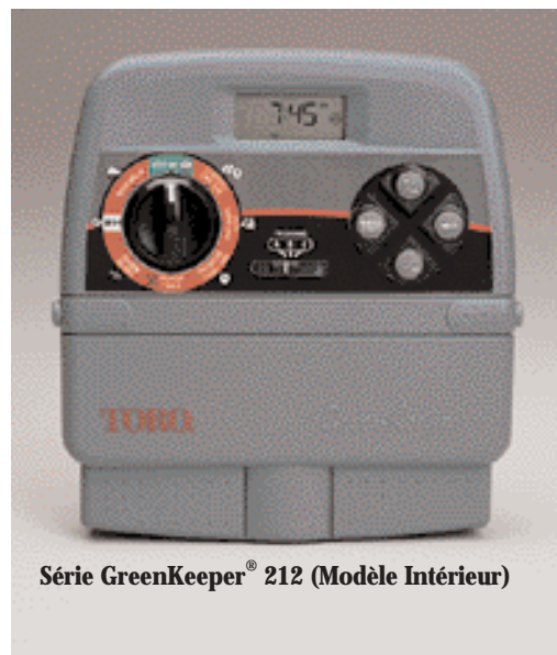
Série GreenKeeper® 212 (Modèle Intérieur)