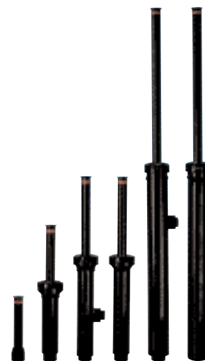
Shrub 4P 6P-SI 6P 12P-SI 12P